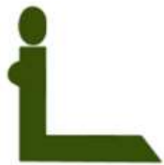
Betende Frau Donna che prega

Tatsächlich bietet die Hauptinsel mit ihren zahlreichen umliegenden kleineren Inseln eine abwechslungsreiche Landschaft mit vielen Naturschönheiten und natürlichen Ressourcen. Gleichzeitig ist Taiwan aber auch führend auf dem Gebiet der Hightech-Industrie. Und die Hauptstadt Taipeh ist eine hochmoderne Millionenstadt.