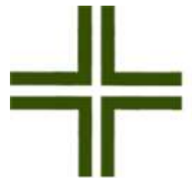
Keltisches Kreuz La croce celtica

Nach politisch sehr bewegten Zeiten mit vielen Machtwechseln sieht sich Taiwan heute als souveräner Staat, wird aber nur von wenigen Ländern der Welt als solcher anerkannt; da die Volksrepublik China den Machtanspruch auf Taiwan als «chinesische Provinz» erhebt, hat Taiwan seit 1971 auch keinen Sitz mehr in der UNO.