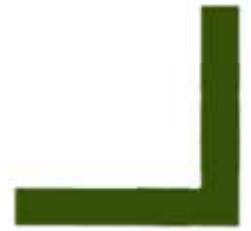
Die Himmelsrichtungen I punti cardinali

Viele kennen die Insel Taiwan, die 180 km weit vor der Küste Chinas zwischen Japan und den Philippinen liegt, noch unter dem Namen Formosa («die Schöne»). So wurde sie im 16. Jahrhundert von portugiesischen Seefahrern benannt.