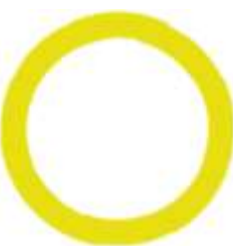
Der Erdball Il globo

Die Bevölkerung Taiwans besteht zur großen Mehrheit aus Nachkommen von seit mehreren Jahrhunderten aus China Eingewanderten. Daneben gibt es mehr als ein Dutzend indigene Stämme mit ihren eigenen Sprachen.